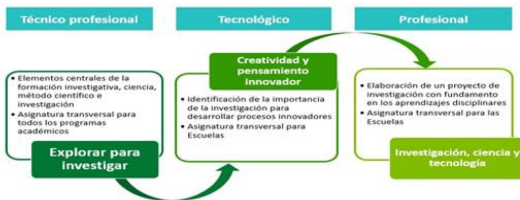
Figura 4 - Alcance de la investigación por nivel de formación