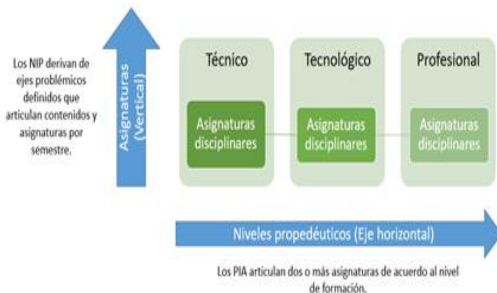
Figura 6. Relaciones curriculares NIP y PIA

La articulación entre los PIA y los NIP se da gracias a su cruce dentro de la malla curricular dispuesta al interior de los programas, que aprovecha no solo los niveles de formación propedéutica (horizontal) en el caso de los PIA sino los componentes propios de las asignaturas en cada semestre (vertical) en el caso de los NIP. La siguiente gráfica ejemplifica esta relación: