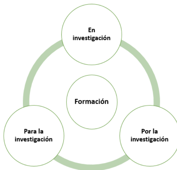
Figura 3. Elementos de relación entre la formación y la investigación

Fuente: Elaboración propia a partir de Rojas y Aguirre (2015).