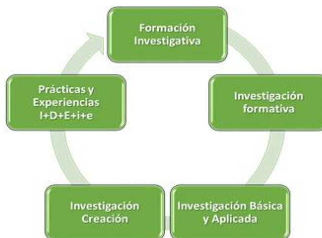
Figura 2. Espacios dinamizadores de la investigación en la CUN

Fuente: Elaboración propia a partir de la Política General de Investigación (CUN, 2017).